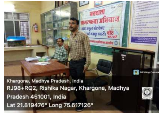
Khargone, Madhya Pradesh, India RJ98+RQ2, Rishika Nagar, Khargone, Madhya Pradesh 451001, India Lat 21.819476° Long 75.617126°