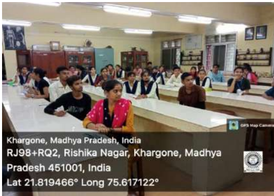
Khargone, Madhya Pradesh, India RJ98+RQ2, Rishika Nagar, Khargone, Madhya Pradesh 451001, India Lat 21.819466° Long 75.617122°