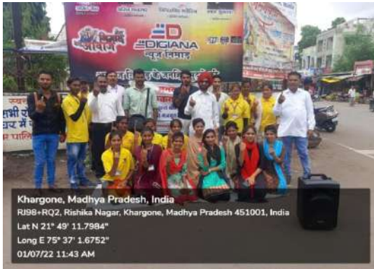
Khargone, Madhya Pradesh, India RJ98+RQ2, Rishika Nagar, Khargone, Madhya Pradesh 451001, India Lat N 21° 49' 11.7994" Long E 75° 37' 1.6752" 01/07/22 11:43 AM