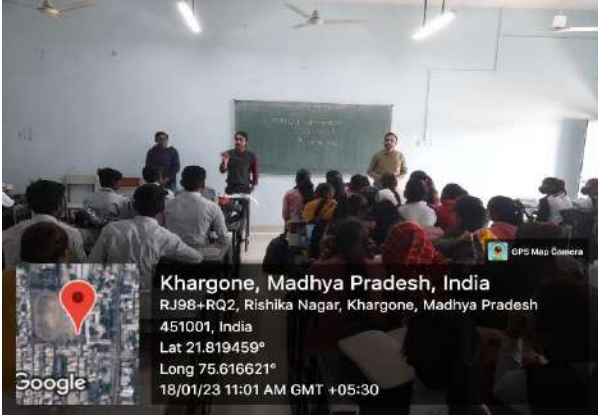
फोटो एवं न्यूजपेपर कटिंग