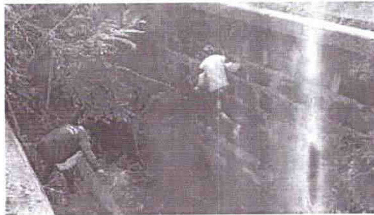
पंचम व छटवा दिवस